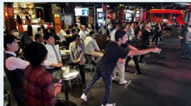
R5会員大会「交流ダーツ大会」