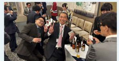
R6一都四県交流会「埼玉地酒試飲会」