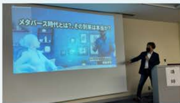
R4会員大会「メタバースセミナー」