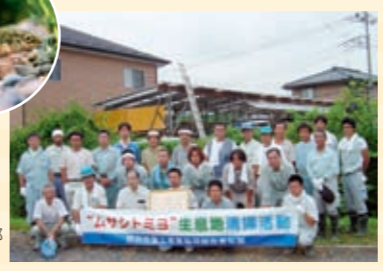
熊谷市管工事業協同組合青年部による清掃活動