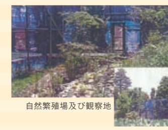
自然繁殖場及び観察地

クツワムシの繁殖・自然放出活動 さいたまグリーン事業協同組合 さいたま市東南部近郊は、多くの世帯が緑化樹木の生産・流通と造園事業関連に従事し、緑が豊かな地域であったが、平成13年10月の「埼玉スタジアム2002」(サッカー場)のオープンによる道路整備や、埼玉高速鉄道「浦和美園駅」周辺の都市区画整理事業に伴う開発等で、自然が急激に減少してきた。 そこで、緑と自然に深く関わっている造園工業業又は造園業を行う事業者の組合として、自然保護活動を実施することとし、なかでも、絶滅危惧種のクツワムシ(ガシャガシャ)の繁殖、自然放出を主力に取り組みを開始した。 平成14年に320㎡、翌年には500㎡の土地に、自然繁殖場及び観察地を完成させ、クツワムシ、キリギリス、カンタン等を卵で越冬、春に幼虫がふ化する環境づくりを整備し、毎年、100匹を繁殖させ自然に放している。また、虫の音の時期(7月~10月)以外は、誰でもが自由に見学ができる観察地として開放している。 行政・関係機関から、事業者の集まりの団体(組合)が、このような地域社会活動に取り組むことに対して、高い評価を得ている。