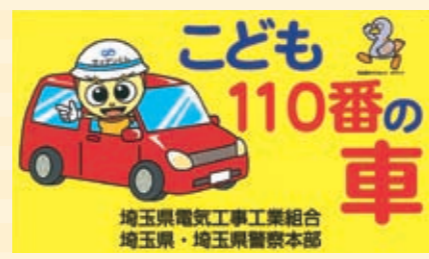
子ども110番ステッカー

18支部の様々なボランティア活動 埼玉県電気工事工業組合 平成15年から、県内18支部が、その支部ごとに活動内容を決め、特色あるボランティア活動を実施している。具体的には、道路・歩道の清掃、違反広告物の撤去、高齢者宅の電気安全点検、市民駐車場の草刈り、防犯灯の清掃、秩父山中のヒノキの枝打ち等、正に多岐に亘っている。 18支部の活動内容は、全て業界新聞に記事として掲載されており、また、内外から高い評価を得ており、組合の知名度は高まっている。また、この活動により、各支部の結束力、協調力も、非常に高まっている。 なお、平成18年には、組合は県と「防犯のまちづくりに関する協定」を締結し、組合員の事業所車両1,500台に防犯ステッカーを貼り、県民の安全な暮らしに協力している。一方、19年にも、組合は県と「災害時における電気設備等の復旧に関する協定」を締結し、県内での災害発生時に県の要請に応じ、組合員1,473社は公共施設等における電気設備等の復旧活動と事故防止、二次災害発見時の連絡等を行うこととし、県民の安全な暮らしに協力している。