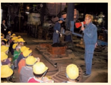
鑄物工場見学の風景

小学生の「工場見学」受け入れ活動 川口鑄物工業協同組合 組合は、平成6年に川口市に対し市内小学校の社会科課外授業カリキュラムに「鑄物工場見学」を組み入れるよう要望した。その結果、小学3年生の社会科課外授業「市内の製造業の仕事」の工場見学のために、組合が受け入れ窓口となって、傘下の組合員企業の工場「鑄物工場見学」を受け入れることとなった。 組合では、見学する小学生の安全性を考慮し、見学コースが十分確保できる組合員企業を選定しており、デザイン→鑄型作り→模様押し→型焼き→中子づくり→鑄型の組立て→注湯→型出し→釜焼き→仕上げ→着色→完成という鑄物ができるまでの作業を、直ぐ近くで、安全に見学できるよう努め実施している。 平成6年からの「鑄物工場見学」の受け入れ総児童数は、6万人を超え、川口の鑄物の歴史、地場産業として鑄物産業等に対する認識、理解が非常に高まっている。