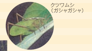
クツワムシ(ガシャガシャ)